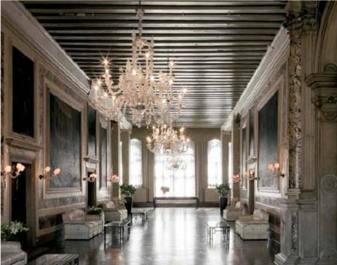
SALONE DELLE FESTE