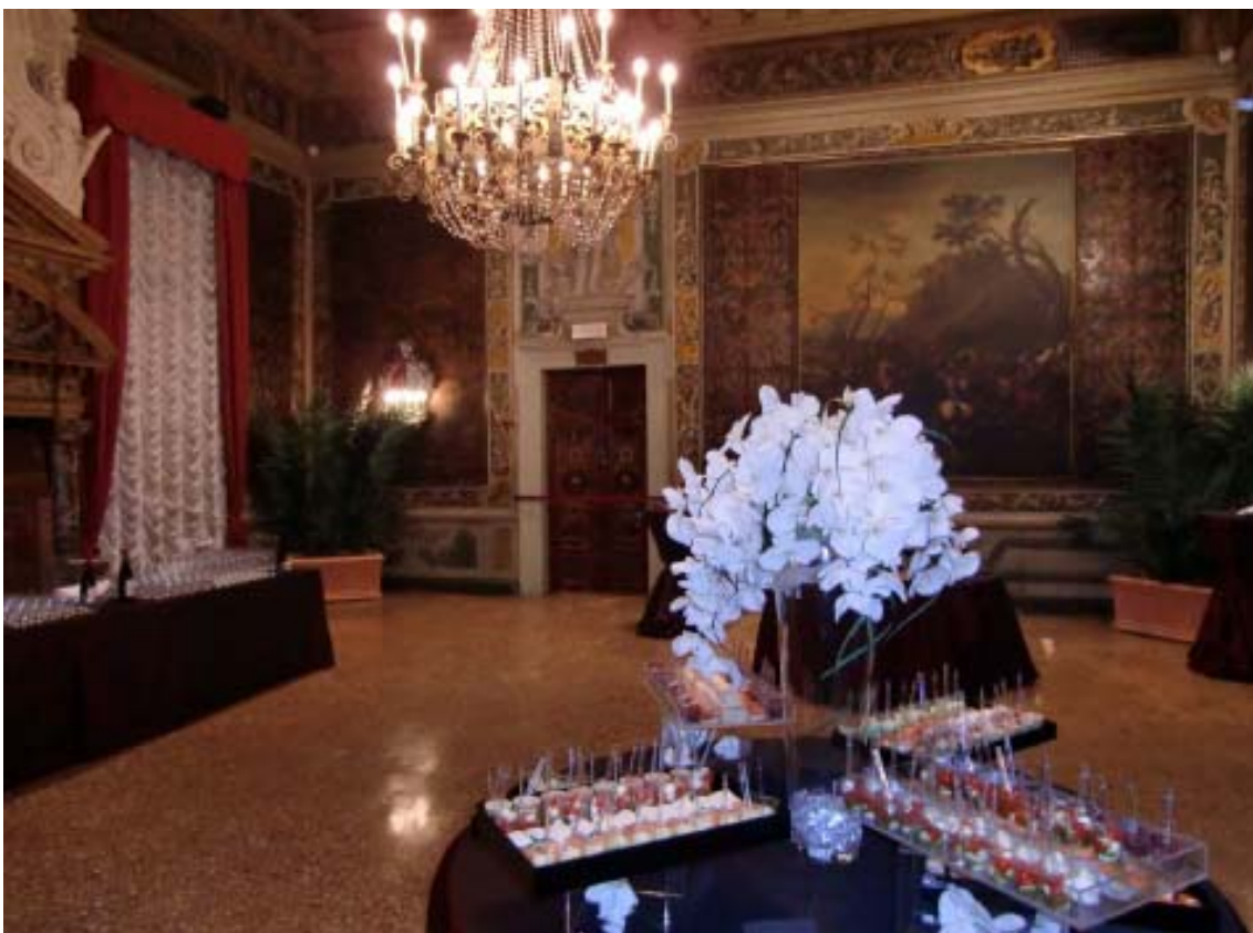
SALA DEL CAMINETTO